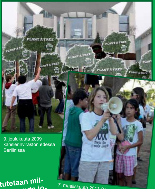
9. joulukuuta 2009 kanslerinviraston edessä Berliinissä

Jos vain muutamat lapset istuttavat puita, ehkä yksittäinen puu ei vaikuta paljon, mutta jos lapset ympäri maailmaa osallistuvat ja istuttavat puita, voidaan maailmaa muuttaa yhdessä. Antonia, 12 vuotta